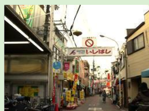
石橋商店街(池田市)