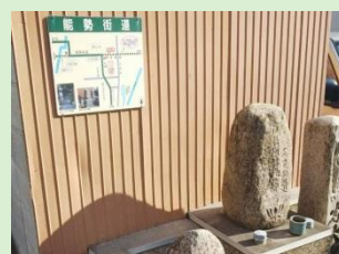
井口堂道標(池田市)