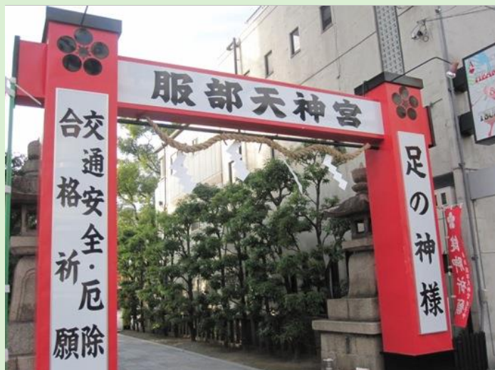
足の神様・服部天神宮(豊中市)