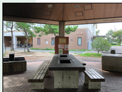
屋根下テーブル8台