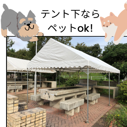
テント下テーブル9台